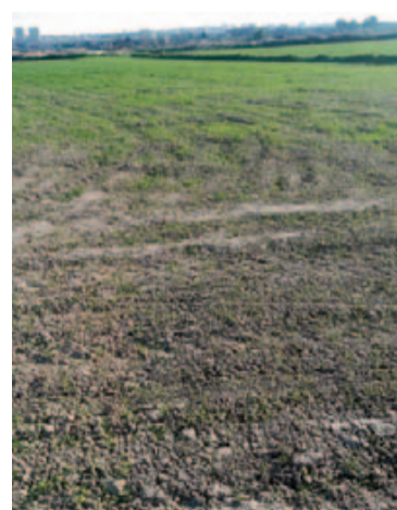
Daños en frutales y en un campo de cereal por conejos. ARAG-ASAJA

más, si se suceden el tiempo, terminan con las indemnizaciones. Han apelado a la voluntad de las Sociedades de Cazadores para pedirles que actúen con el fin de eliminarle los daños... con resultados dispares. Lo han intentado todo».