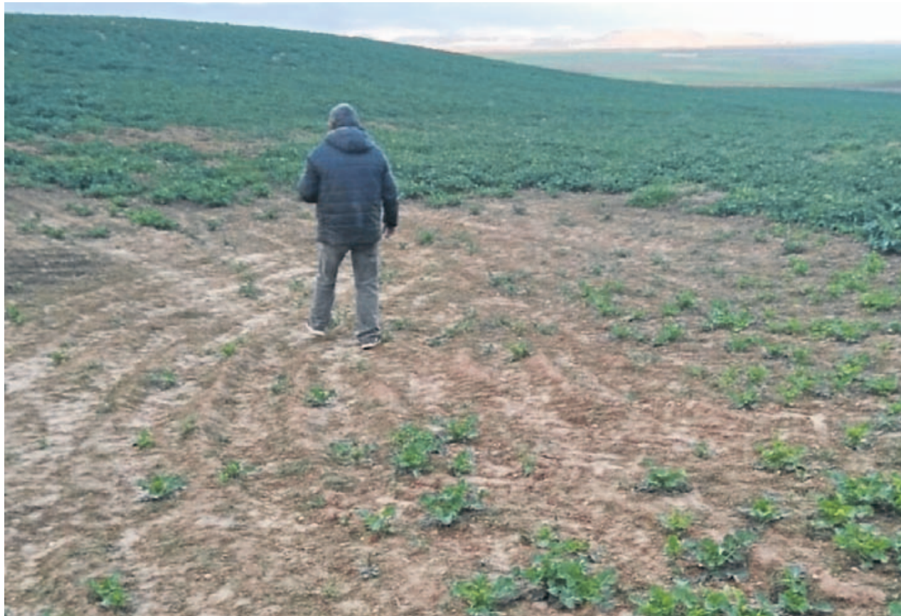
Sensibles daños causados por conejos en un campo de colza riojano.