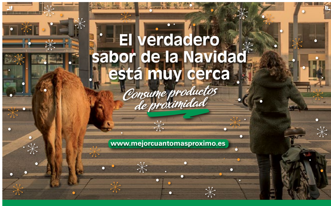
ARAG-ASAJA impulsa una campaña para fomentar el consumo de alimentos riojanos en apoyo de los agricultores y ganaderos riojanos