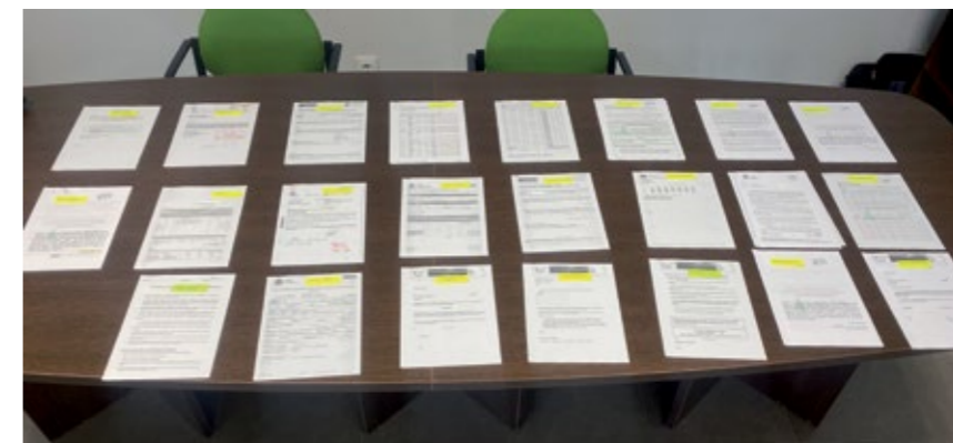
Imagen con los 22 procedimientos que tiene que hacer un agricultor para contratar un trabajador

Me parece una buena propuesta por parte de ARAG-ASAJA en el sentido de que incentiva la creación de explotaciones más competitivas y útiles para la generación de valor. Además, no es una locura de dinero, suprimir lo que queda de ese impuesto es el chocolate del loro. Quizás para evitar abusos