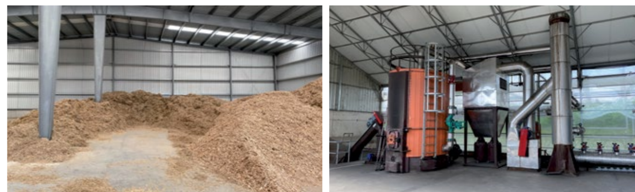
RiojaSelecto produce el 50% de la caña que utiliza para la generación de biomasa.

“De cara al futuro, no hay ningún problema en ser más verdes, pero solo pedimos que no maten a la gente por el camino. Europa no puede ser ecologista a costa de la rentabilidad del agricultor”